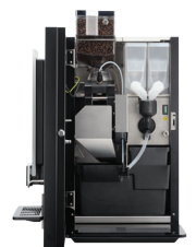
OB 3 (XL) NG