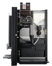
OB 2 (XL) NG